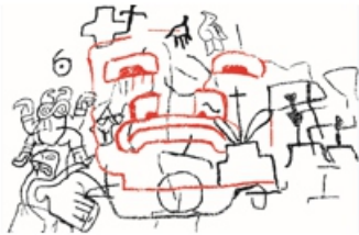
Lamina N° 7 En color rojo para diferenciar el motivo Sechín presente en el sitio denominado como el Alto de la Guitarra,

El resultado de nuestras investigaciones en el sitio denominado Alto de la Guitarras, se ha identificado representaciones visuales graficadas sobre la superficie de soportes rocosos como pertenecientes también al estilo Sechín, se trata de un soporte grande en sus dimensiones que a juzgar por su conformación de rasgos, consideramos estrechamente relacionado con elementos al estilo Sechín, se trata de una cabeza redondeada, nariz ancha y una boca de labios gruesos.