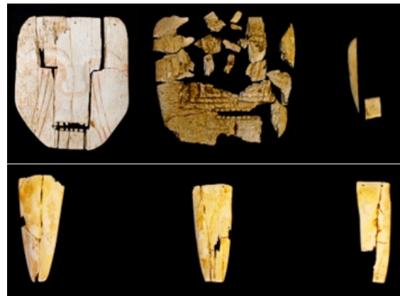
Lamina N° 2 Material óseo de origen paleontológico.

En la muestra se observó la presencia de tres colgantes de una consistencia más delgada y una conformación ligeramente curva. A juzgar por su consistencia, es factible que estas pertenecerían a alguna concavidad de índole craneal de origen animal. Su estado de conservación muestra fragmentos que fueron adheridos conformando piezas más completas. En su manufactura evidencian contornos de bordes que han sido trabajados por la mano del hombre, logrando un redondeado en sus extremos, siendo más notorio en el extremo inferior, mientras que en la parte superior del soporte presenta dos orificios cuya función a juzgar se trataría de colgantes, en uno de ellos en la esquina del soporte óseo denota un faltante. Mientras que para el colgante C fue notorio identificar la presencia de un corte recto en su manufactura observado en el extremo inferior. Dicho material posteriormente de su documentación fue inscrito y registrado en el Ministerio de Cultura, con la finalidad de legalizar la colección y conformar un museo en memoria de don Max Díaz, registrados durante las actividades de Catalogación y Registro de Bienes Culturales, en el año 2010 en la ciudad de Lima.