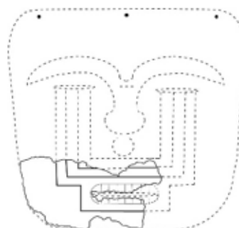
Lamina N° 4 Mascara con modelo rectilíneo de los