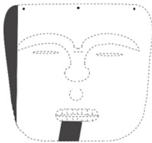
Lamina N° 5 Proyección de máscara de menor tamaño

De este soporte se identificó solamente 2 fragmentos pertenecientes a la misma textura uniforme y de conformación semejante comparativamente al primer soporte, lo diferencial son sus dimensiones. Se tomó como referente a un fragmento cuya dimensión muestra que se trata del lado derecho alcanzando 9.6 cm de altura, 15 cm de largo y 7 mm de ancho con un peso de 10 grs. No existiendo más fragmentos que una parte central de lo que fuera el soporte.