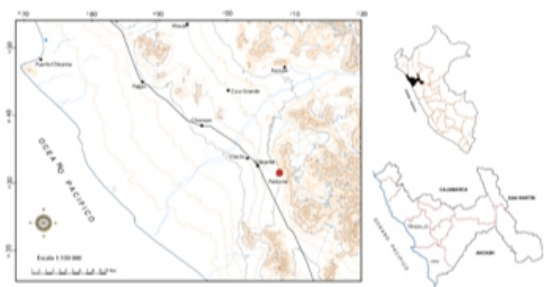
Lamina N° 1 Ubicación del sitio en el valle Chicama.

Los objetivos de la investigación estuvo centrada en los materiales y un reconocimiento en el valle Chicama, en razón a que este fue considerado por varios estudiosos como cuna de la alta cultura, en razón a que contiene un rico depositario de testimonios arqueológicos que dan cuenta sobre la dispersión espacial, profundidad temporal y característica contextual de los distintos sistemas socio-culturales que la ocuparon y se desarrollaron en esta parte del territorio en la costa norte de Perú (Larco 1948, Kosok 1965).