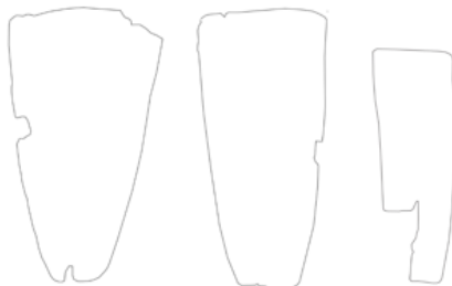
Lamina N° 6 Colgantes con orificios en sus extremos