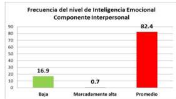
Figura 3: Niveles del componente interpersonal del cociente emocional

En lo que se refiere a la figura N°3 las frecuencias correspondientes al nivel del componente Interpersonal del cociente emocional se encontró con mayor frecuencia el nivel correspondiente a promedio (82.4%) y en menor frecuencia el nivel marcadamente alta (0.7%).