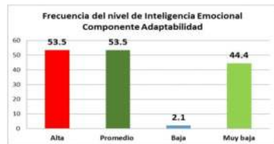
Figura 4: Niveles del componente adaptabilidad del cociente emocional

En relación a la figura N°4 las frecuencias correspondientes al nivel del componente adaptabilidad se encontró con mayor frecuencia los niveles correspondientes a alto y promedio (53.5%) y en menor frecuencia el nivel bajo (2.1%).