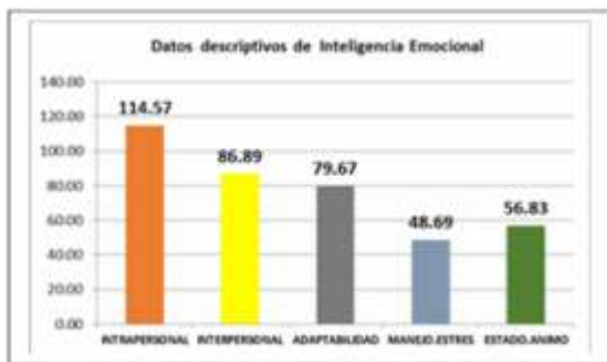
Figura 1. Puntajes promedio de los componentes de inteligencia emocional

En la figura 1 se observan los puntajes promedio de todos los componentes del cociente emocional, presentando el mayor puntaje el componente Intrapersonal (114.57) y promedio menor en el componente Manejo de Estrés (48.69)